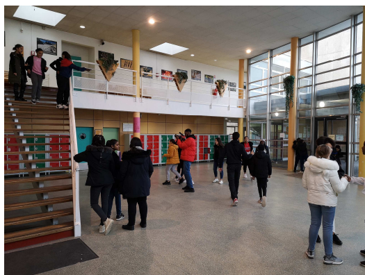
Photo issue du tournage du court-métrage, le 27 janvier 2020

Nous avons eu la chance, comme l'année dernière, de pouvoir réaliser ce court-métrage avec l'intervention d'une société de réalisation : LA CERISE. Un professionnel a pu apporter son expertise et son matériel. Il a également coordonné l'écriture du scénario et le tournage du film.